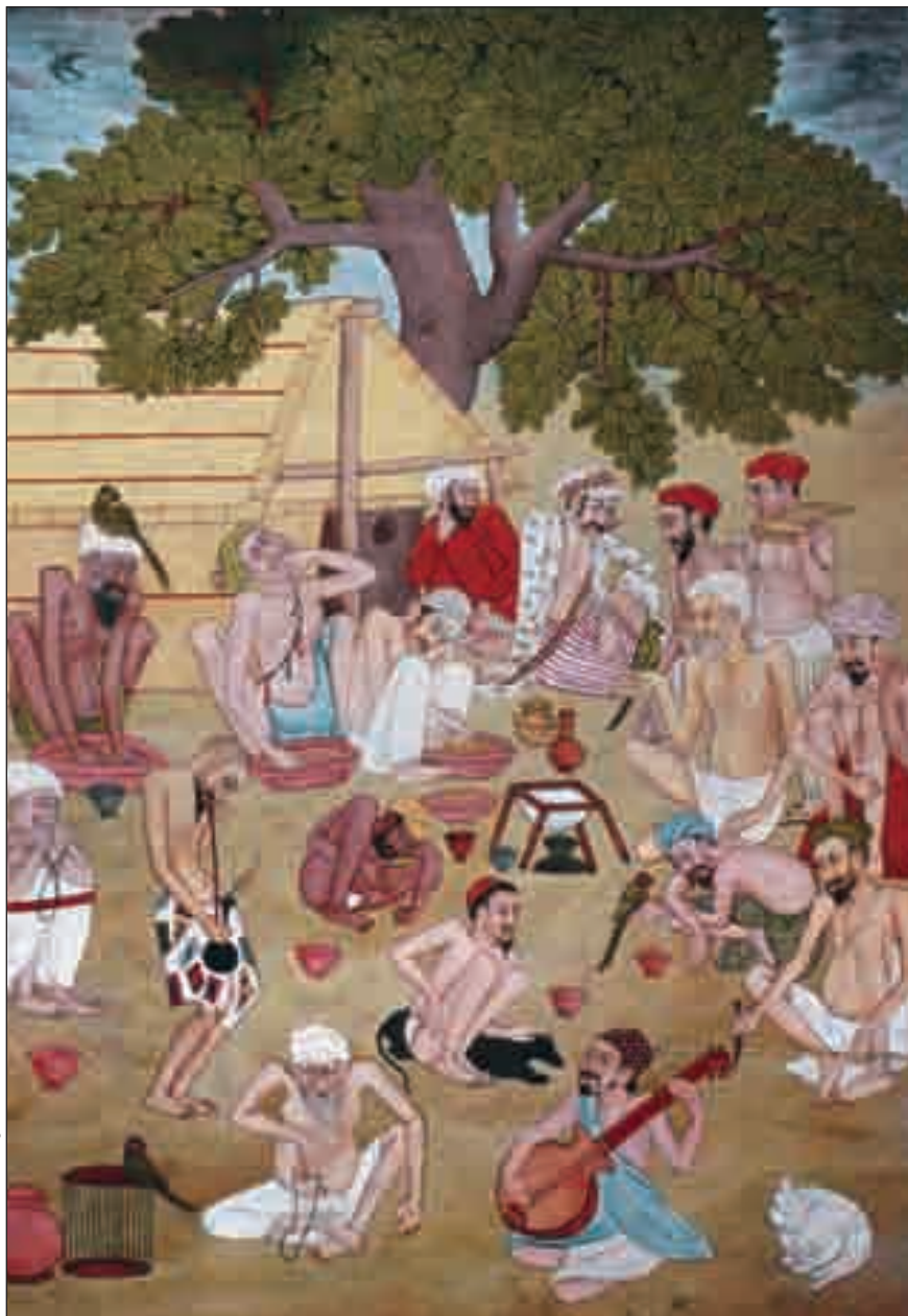
Roland et Sabrina Michaud / Rapho

Le cannabis se fume en Asie depuis des siècles (miniature indienne).