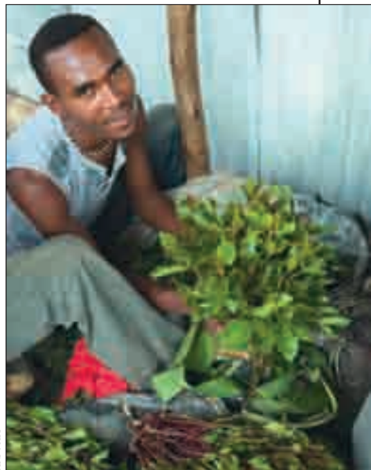
Sur le mercato d'Addis-Abeba, la feuille de khat arrive fraîche, prête à être consommée.

Le trafic de cette drogue a provoqué des conflits armés partout dans la Corne d'Afrique, et aussi au Yémen. Les experts américains affirment que les revenus de sa vente financent les terroristes au Yémen et en Somalie. Il