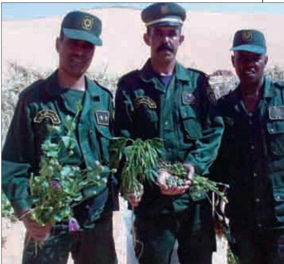
Dans le Sud, les officiers de la Sécurité nationale perèrent et détruisent régulièrement des champs de pavots.

quelques tentatives avortées d'implantation de cannabis dans des zones désertiques, ne devienne une plaque tournante de ces activités illicites