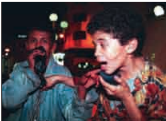
Les enfants de la rue sont les principales victimes de la colle.

Le recours à cette drogue, qu'on trouve en pot à la droguerie du coin – excusez du peu ! –, n'a même pas besoin de têtes pensantes, de réseau, de trafiquants... Plus éphémère mais réputée efficace, la clope roulée à la poudre de cafards nécessite un semblant de technique ; le pot de glu, lui,