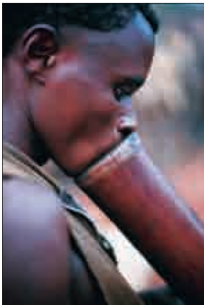
V. Duranty / Rupto

Le cannabis, ou chanvre indien, qui se prend sous forme d'herbe fumée (marijuana, kif, dagga, ganja, etc.) ou