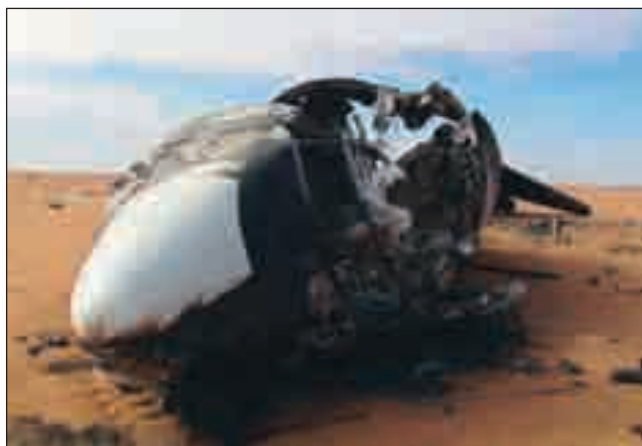
La carcasse du Boeing 727 gît en plein désert.

bine d'Al-Qaïda (Al-Qaïda au Maghreb islamique), des milices communautaires et des bandits de grand chemin. Il a été établi, depuis, que cet avion avait décollé du Venezuela et atterri sur cette piste naturelle, peut-être en urgence et à la suite d'une avarie. Une fois posé, il a été déchargé de la dizaine de tonnes de cocaïne qu'il transportait, laquelle a été ensuite acheminée vers le Niger. Incapable de reprendre l'air pour des raisons techniques, l'avion a été incendié par les