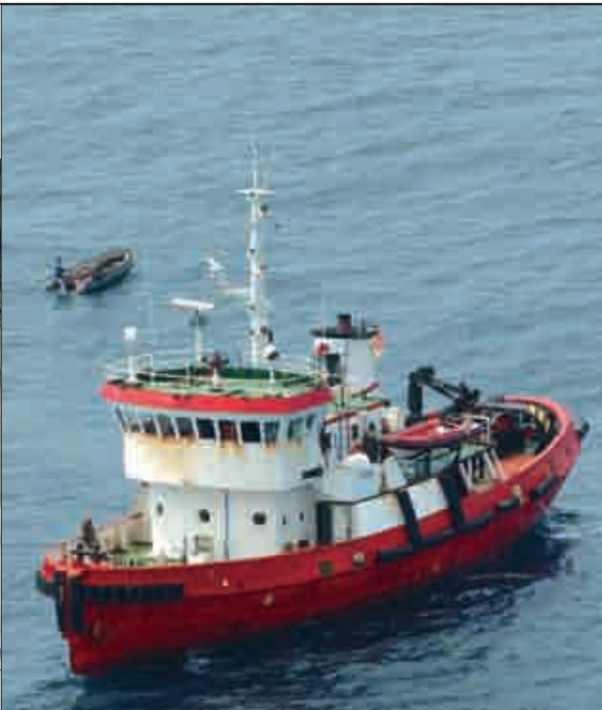
Le « Pitea », intercepté le 5 juillet au large du Ghana, chargé de 2 tonnes de cocaïne.